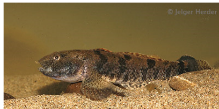
Marm grondel